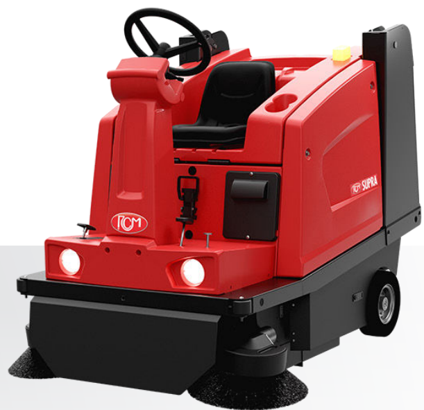
SUPRA E SA Scarico idraulico Hydraulic dumping Descarga hidráulico