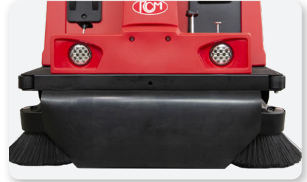
Convogliatore polvere Dust conveyor Encaminador de polvo