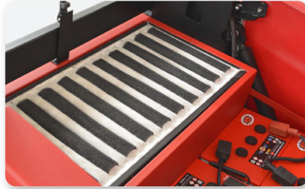
Kit filtro multitasche Polyester sach filter kit Kit de filtro de saco de poliéster