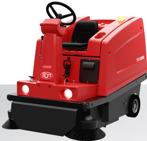
SUPRA E Scarico manuale Manual dumping Descarga manual