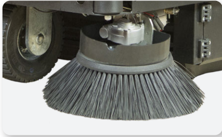
Braccio spazzola laterale sinistro Left side brush arm Brazo lateral izquierda