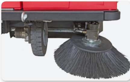
Braccio spazzola laterale sinistro Left side brush arm Brazo de cepillo lateral izquierdo