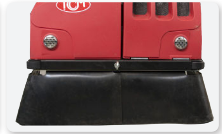
Convogliatore polvere Dust conveyor Encaminador de polvo