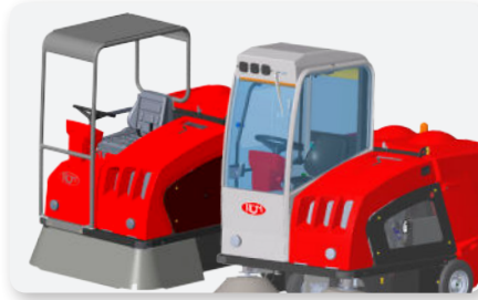
Tettuccio e cabina Canopy and cabin Techo y cabina