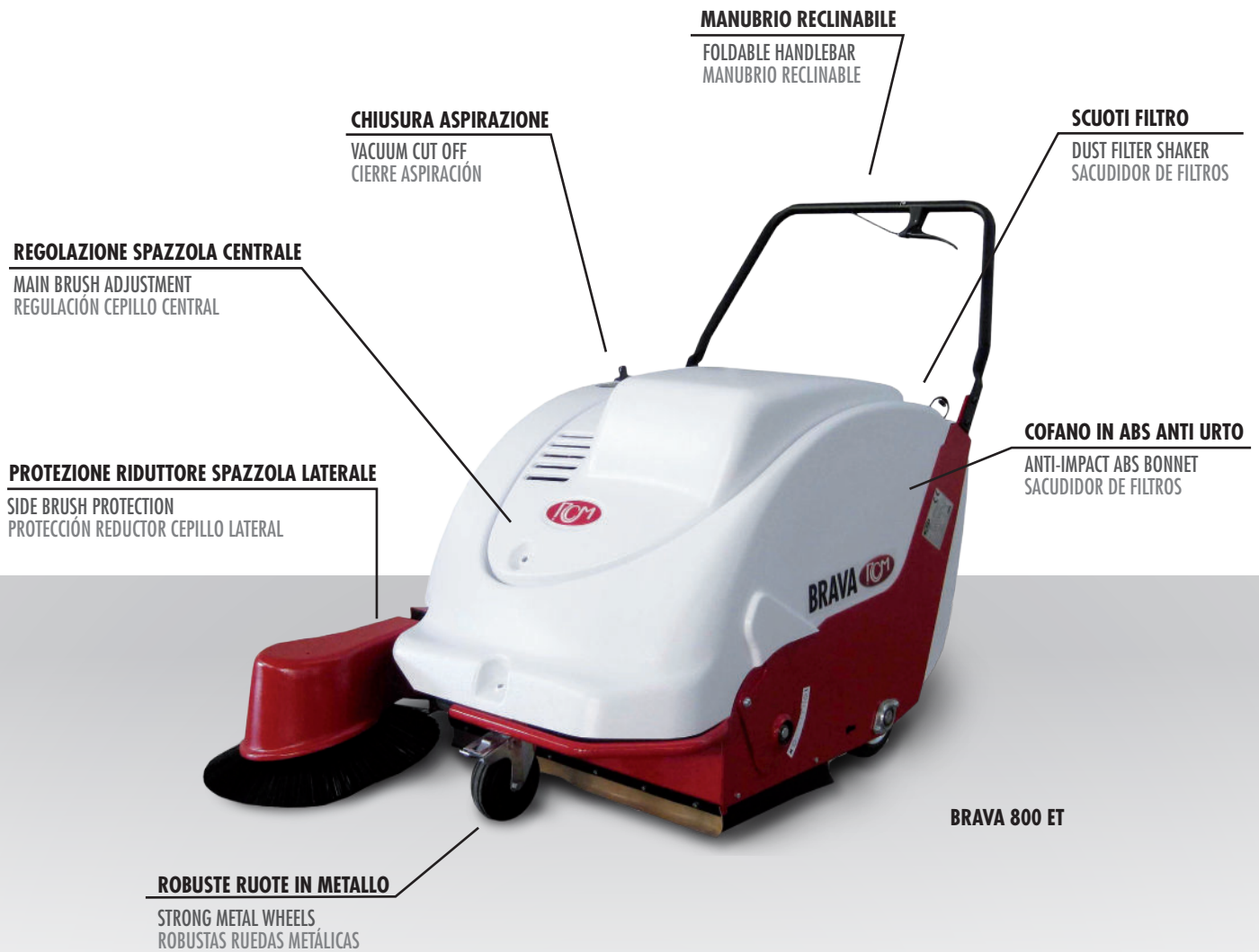
BRAVA 800 ET