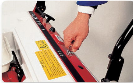
Scuotitore elettrico Electric filter shaker Sacudidor de filtro eléctrico