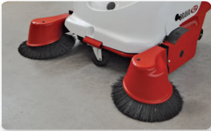
Braccio spazzola laterale sinistro Left side brush arm Brazo lateral izquierda