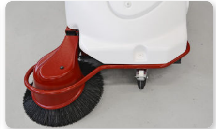
Paraurti Bumper Parachoques